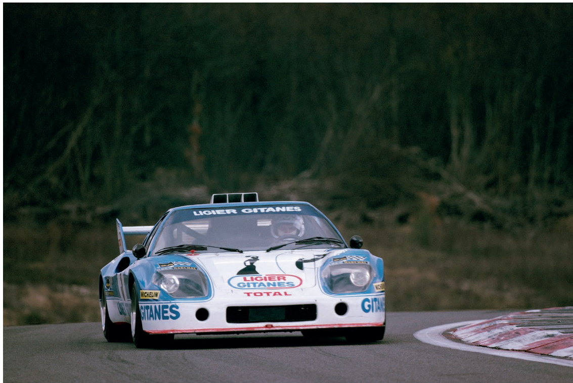
Ligier JS2 - 1975