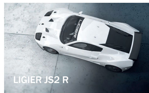
LIGIER JS2 R