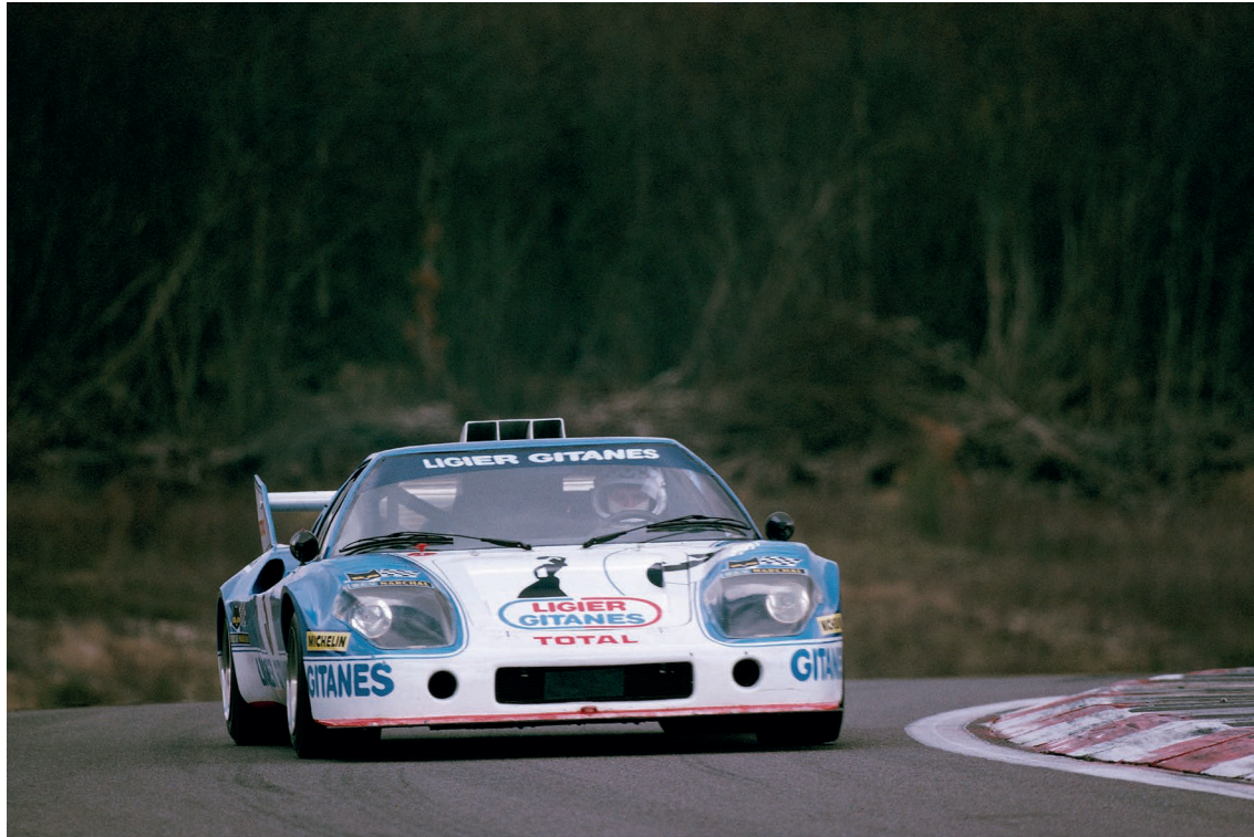
Ligier JS2 - 1975