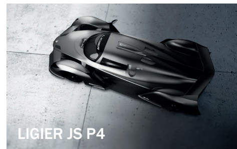
LIGIER JS P4