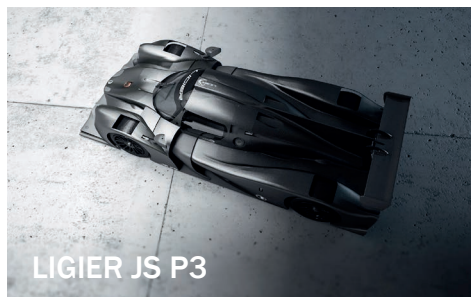
LIGIER JS P3