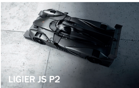
LIGIER JS P2