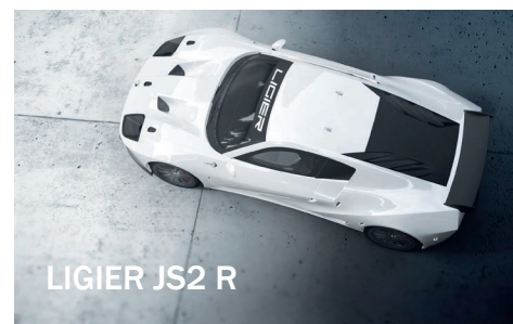
LIGIER JS2 R