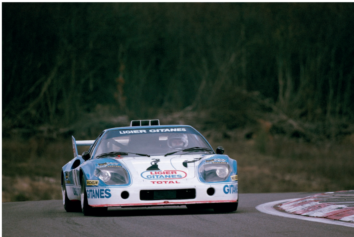
Ligier JS2 - 1975