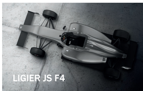
LIGIER JS F4