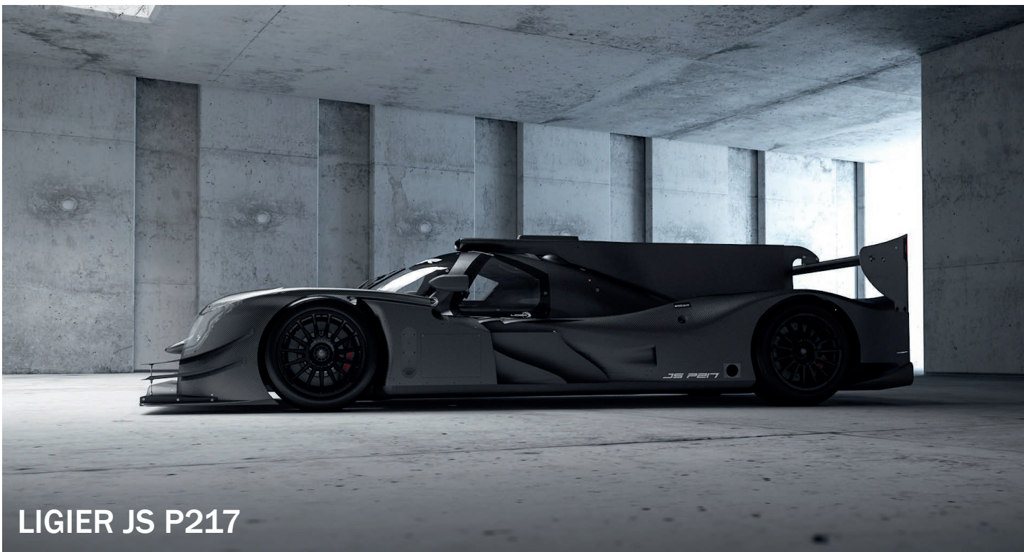
LIGIER JS P217