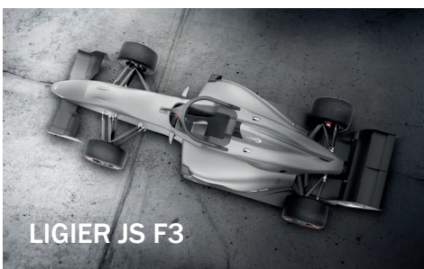
LIGIER JS F3